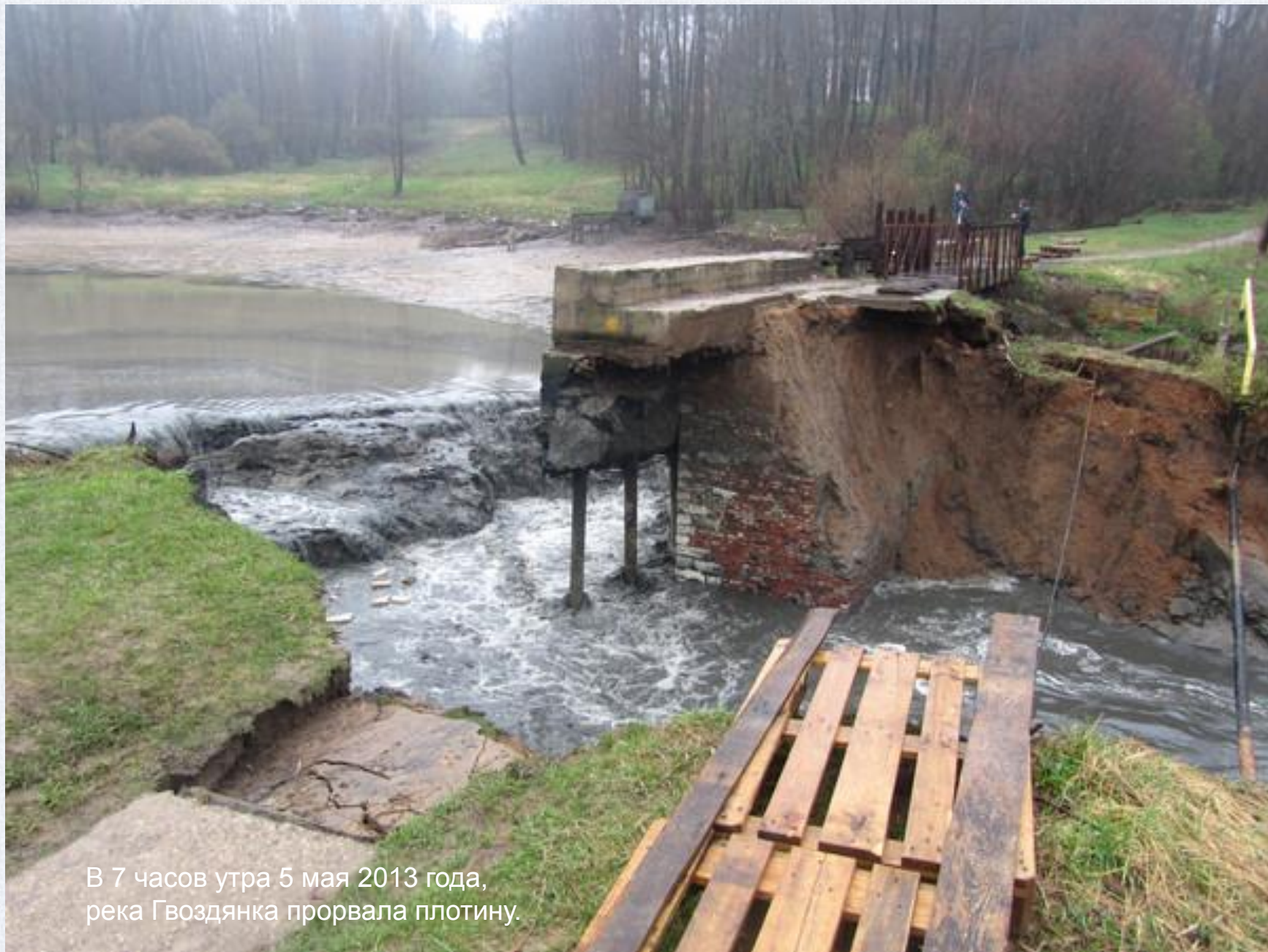
В 7 часов утра 5 мая 2013 года, река Гвоздянка прорвала плотину.